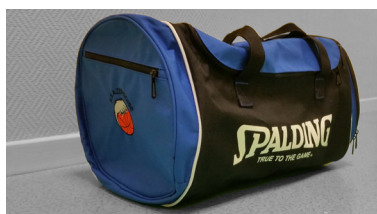
Sac 50L : 33 €

Tailles disponibles : (merci d'indiquer enfant ou adulte)