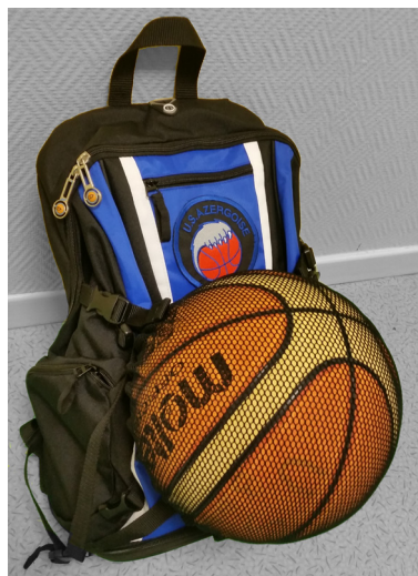
Sac à dos : 39 €