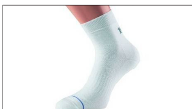
Chaussettes (+logo) : 7 €