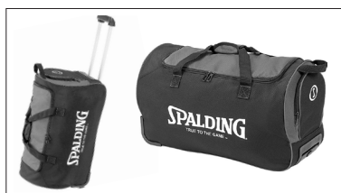
Sac 60L à roulette : 60 €