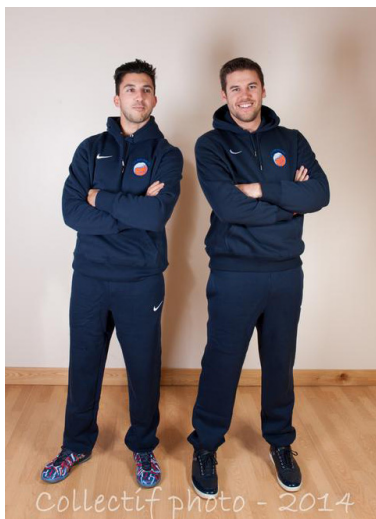
Sweat à capuche : 48 € Pantalon : 36 €