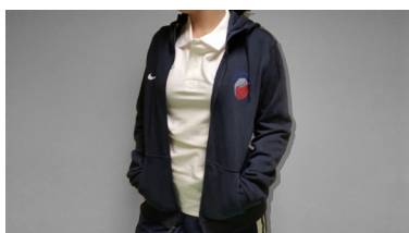
Veste à capuche : 52 € (Sweat à fermeture)